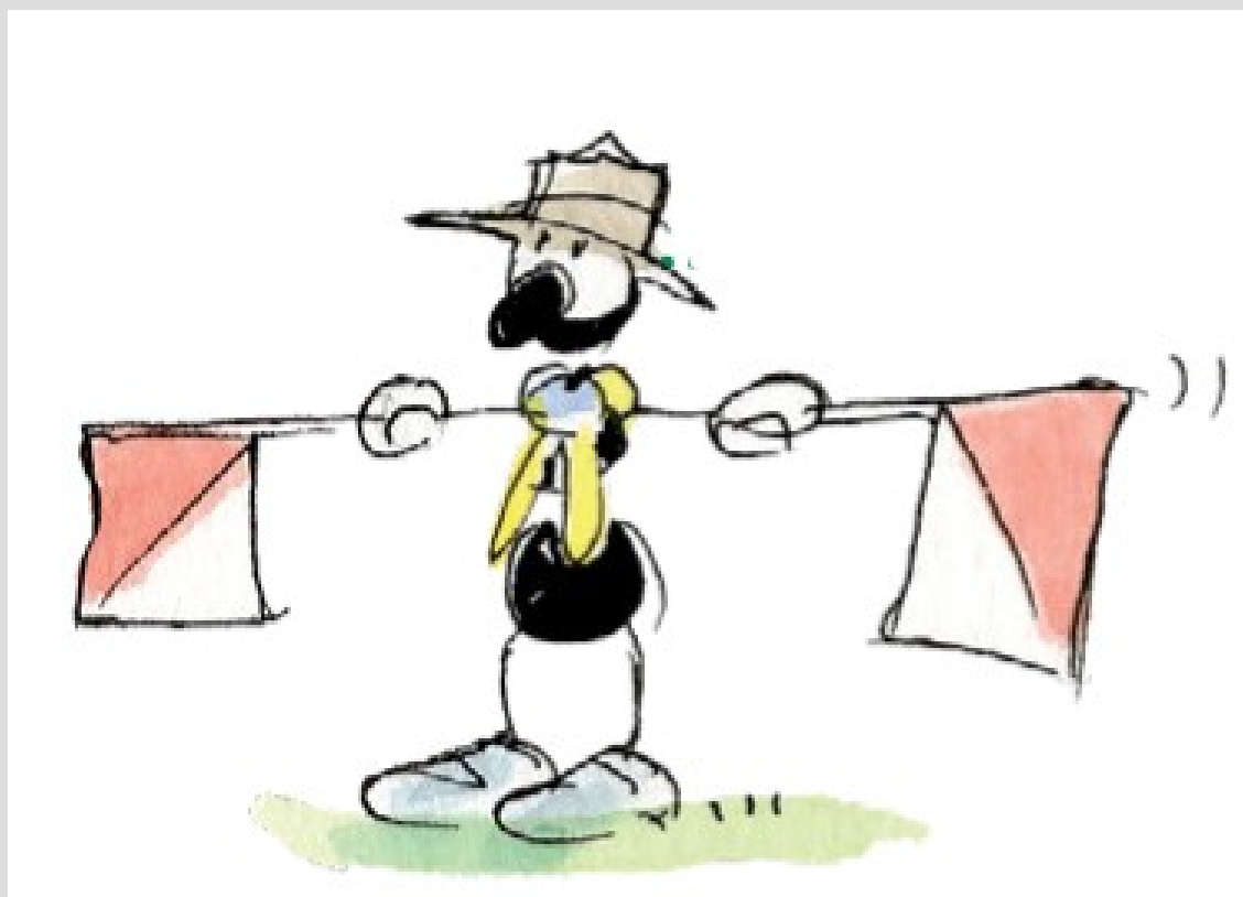
Illustrazioni di Fabio Vettori